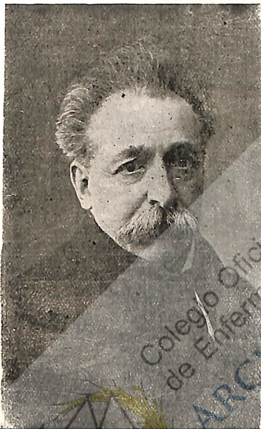
D. José Rodríguez Carracido, ilustre Doctor en Farmacia, fallecido recientemente en Madrid

Nació este insigne hombre de ciencia en Santiago de Compostela, el año 1856; empezó el Bachillerato a los diez años, obteniendo premios en todas las asignaturas. En 1871 comenzó su carrera, que hizo en tres años, por libre, graduándose de Licenciado con nota de sobresaliente y premio extraordinario en 1873.